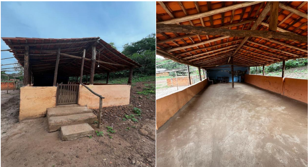
Figura 3 – Capela – parte externa e interna