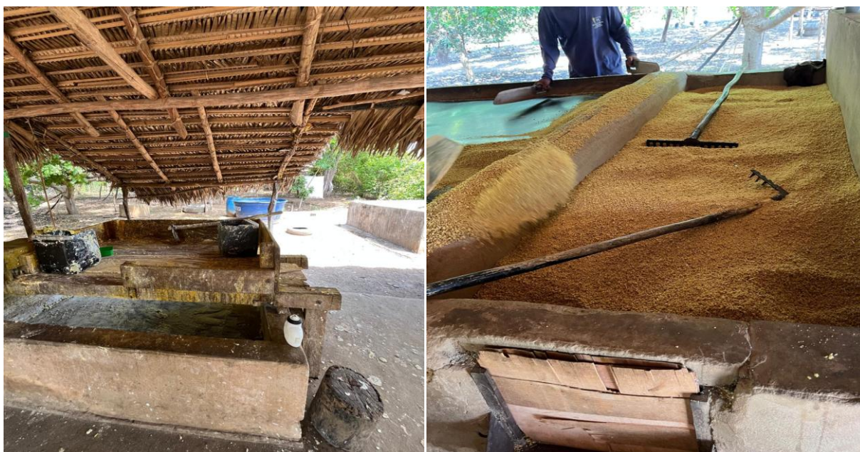
Figura 5 – Local onde se faz farinha – Casa de Farinha