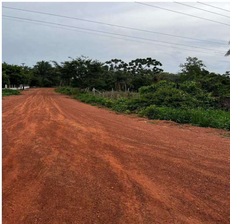
Figura 9 – Entrada da comunidade quilombola Jenipapo