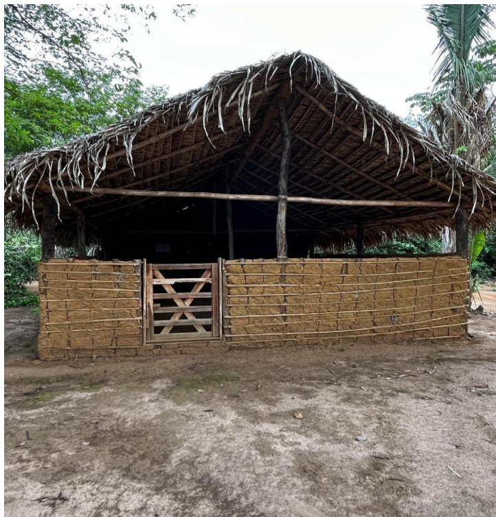
Figura 6 – Local onde os moradores fazem reunião – Associação dos Moradores