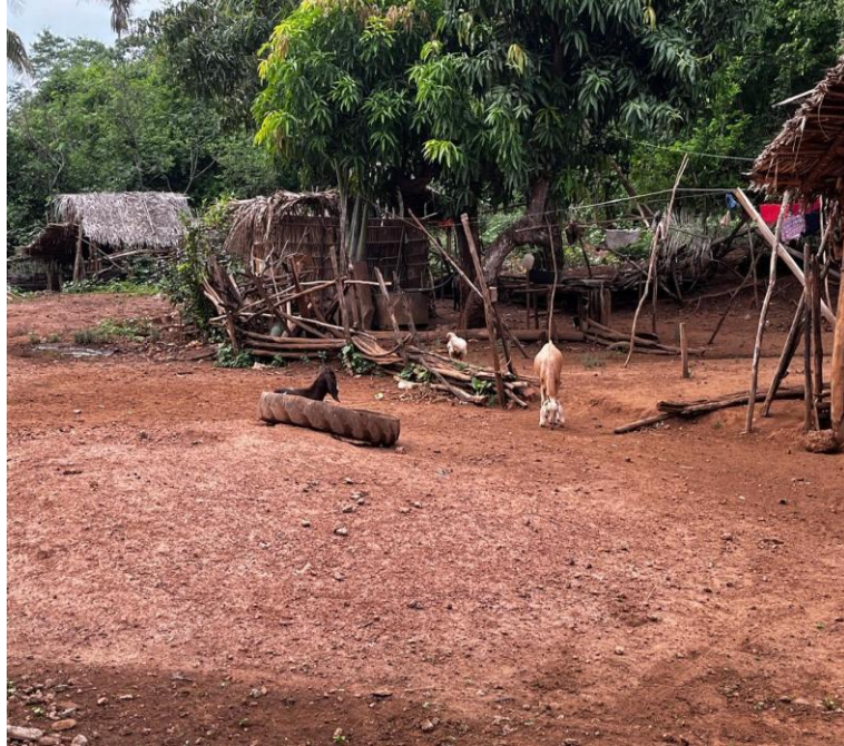
Figura 8 – Algumas criações existentes na comunidade