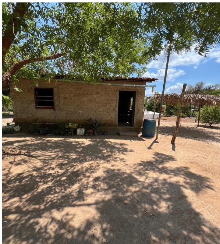
Figura 7 – Casa onde se fazem as ciências da umbanda