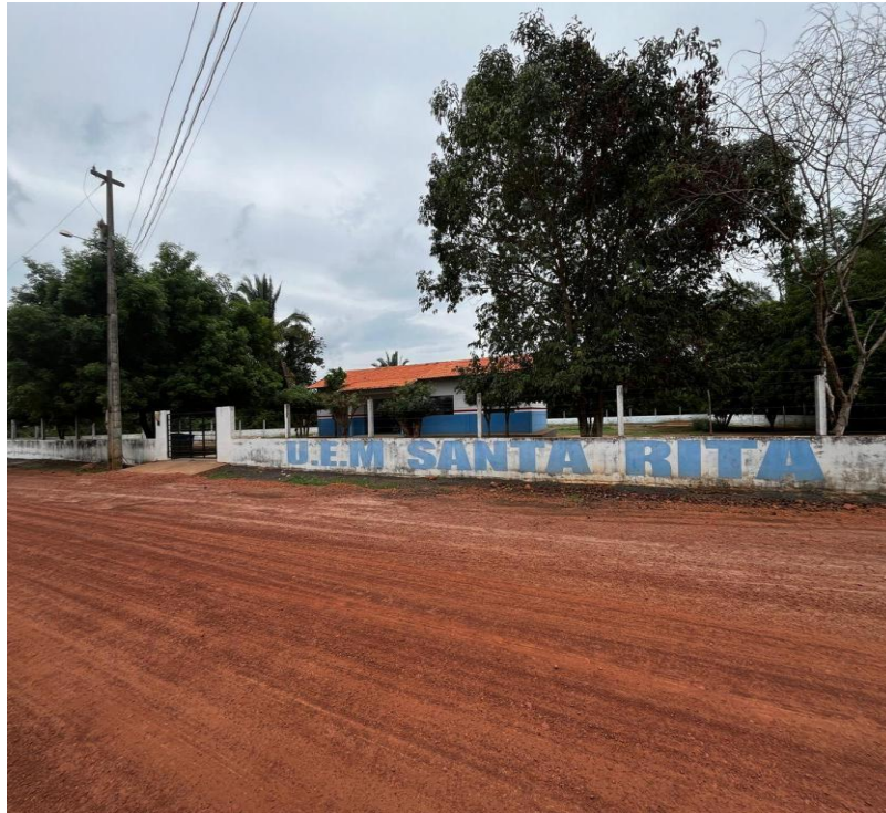
Figura 2 – Escola de ensino fundamental I