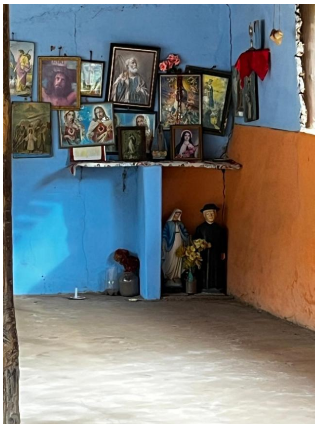
Figura 4 – Santuário – altar