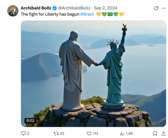
Figura 15 – O Cristo e a Liberdade