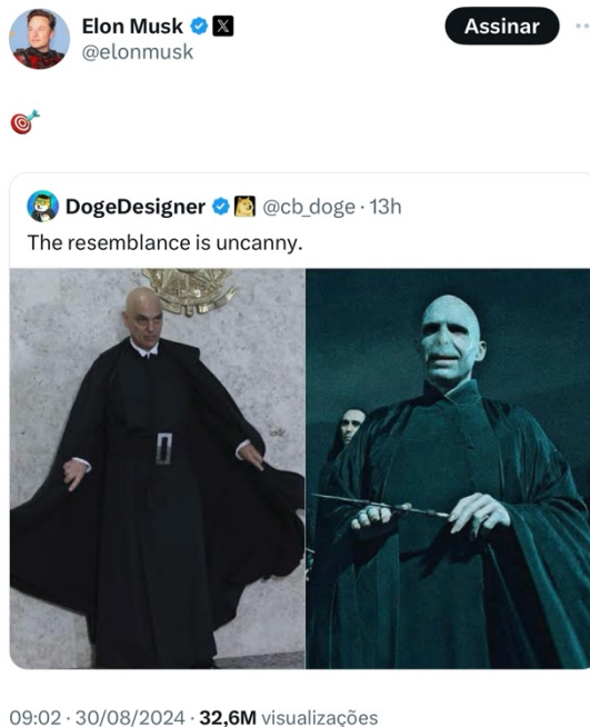
Figura 2 – Moraes = Voldemort

aqui esse perigo tem nome, rosto e aparece textualizado como uma figura misteriosa, inscrita no interior de uma disputa que nunca se fecha.