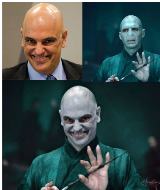
Figura 6 – Montagem com o sujeito-ministro