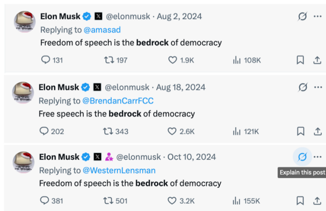
Figura 8 – Free speech , por Elon Musk