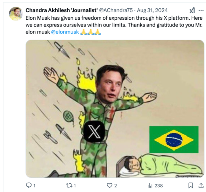
Figura 3 – O herói para o brasileiro

Nesse cenário não existe espaço para a conjunção “e”, não há a possibilidade de coexistência, tudo se sedimenta a partir do “ou”. “Ou você é de esquerda ou de direita”, não há reconfiguração que permita direita “e” esquerda, esse espaço é sempre marcado pela determinação. A decisão do sujeito perante o acontecimento a ler o tensiona para uma posição histórica, linguística e ideológica. É a determinação do sujeito pragmático apontada por Pêcheux (2015), em que a lógica disjuntiva das proposições lógicas só permite a inscrição do sujeito em uma interpretação, não sendo possível x “e” y, a articulação com o contraditório só é possível em uma lógica excludente.