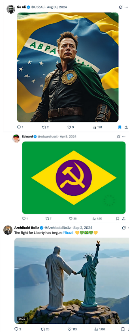
Figura 10 – Heroísmo (inter)nacional