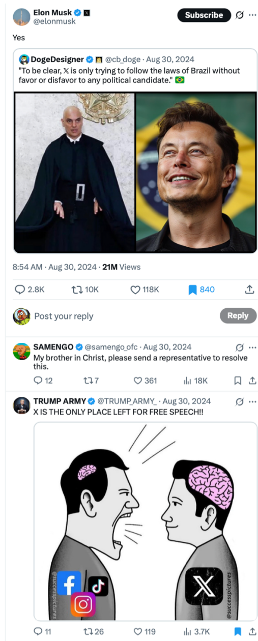
Figura 4 – O fio do X