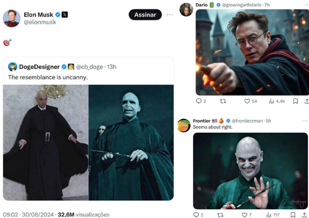
Figura 9 – Hogwarts às avessas