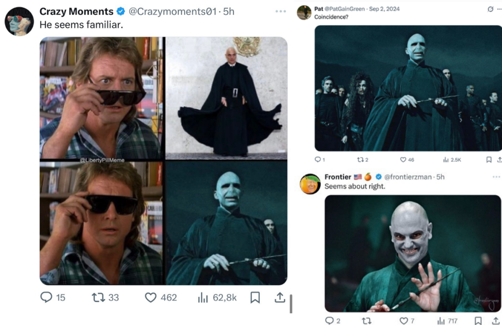
Figura 5 – Alguma semelhança?

O primeiro tweet reúne um meme que retoma uma cena do filme They Live (1988) 16 , na qual o protagonista, ao colocar os óculos escuros, passa a enxergar a verdadeira identidade das pessoas ao seu redor, e a insere em um outro contexto de circulação. Esse recorte do filme é reproduzido incontáveis vezes a partir dessas duas imagens: a primeira em que o protagonista eleva os óculos ao rosto para colocá-los e outra com os óculos já posicionados no rosto, assinalando o processo de repetição-regularização-deslocamento que temos apontado.