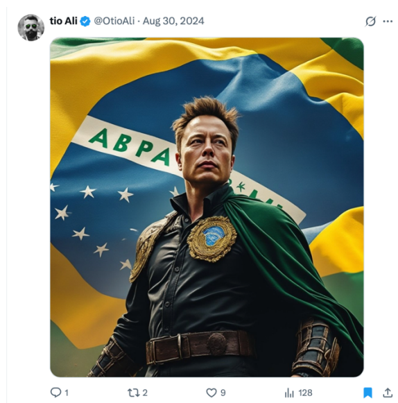
Figura 13 – Musk, o "salvador"

Para prosseguir com a discussão no corpus , trazemos outro recorte. As duas imagens se relacionam pelo modo como uma mesma memória as atravessa e “dá liga” aos sentidos, mobilizando as noções de heroico e vilanesco, como temos explicitado até então. Para além disso, é possível observar como cada uma delas vai trabalhar as contradições na/da outra, na toada do que propõe Lagazzi (2009).