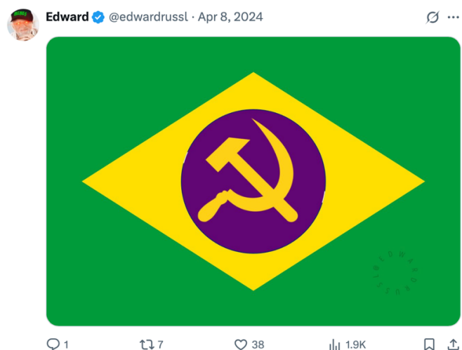
Figura 14 – Bandeira soviética do Brasil