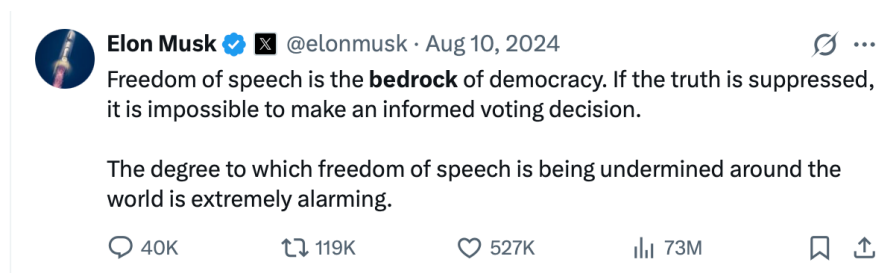
Figura 1 – “ Bedrock ”

A entrega dos corpos à sujeição do mercado marca as chagas da exploração do homem, na busca incessante da multiplicação de seus dividendos. Determinadas formulações resgatam uma memória de resistência às interferências estatais e, portanto, quaisquer medidas que visem regular a atuação das gigantes corporações são encaradas como um disparate à “liberdade”.