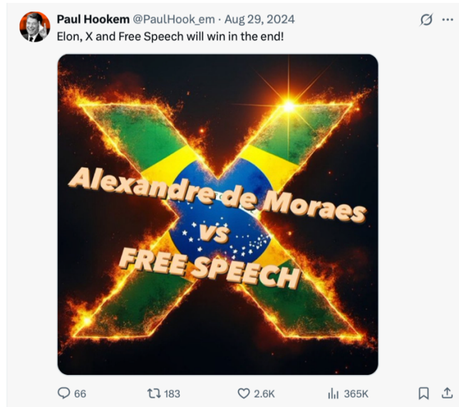
Figura 12 – Alexandre VS Free Speech

Ainda nesse movimento de escuta, a fim de capturar as contradições que se estabelecem nos processos de deslize para outras materialidades, apresento o próximo recorte.